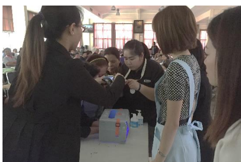
手洗いチェッカーによる指導

今回の専門家派遣事業においても、多くの方の協力を得る事ができました。(1)大田区からは現場の指導や実践に役立つ数多くの介護用レクリエーショングッズ。(2)事業の趣旨に賛同したサラヤ株式会社のタイ工場より石鹸、口腔ケアブラシの無償提供。同社は昨年度の食品衛生