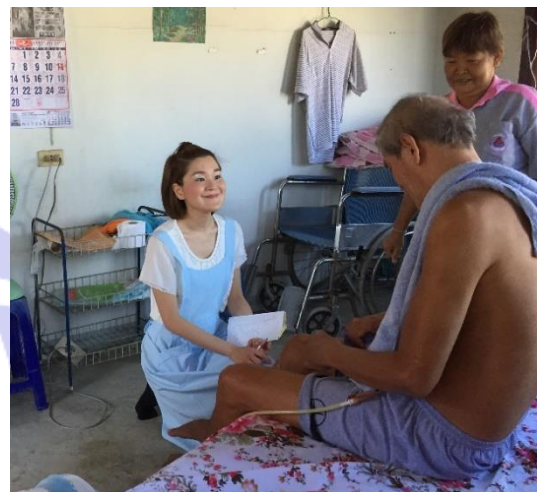
訪問指導を行う専門家

また、施設がないため、現状、高齢者を介護しているのは家族や親戚であり、在宅介護が基本です。そういった家族や親戚、高齢者自身をサポートするために、市民介護ボランティア制度があります。ボランティアと言っても実際には月に600パーツを保健省からもらっていますが、活動時間を考えると、十分な金額ではありません。お金のためではなく、地域のサポートをしたいと思っている温かい人々の集まりです。自主的に登録し、楽しみながら地域を支えている方がタイにはたくさんいます。常時サポートとして活動可能なボランティアは約100名程度ですが、高齢者約6,000人に対して、登録上は600名のボランティアがいます。市民がボランティアで介護サポートをしているため、誤った知識や未熟な技術で介護をしてしまうことがあります。人の愛、温かさはあるが、技術や知識が不足している。そういった市民介護ボランティアに日本の技術や正しい介護指導を行うことが今回の専門家派遣事業のミッションでした。 ベッドでの体位変換、車いすへの乗せ方・降ろし方、足浴、口腔ケアの指導やリハビリの方法など、基礎的事項の指導が、市民介護ボランティアより非常に喜ばれました。