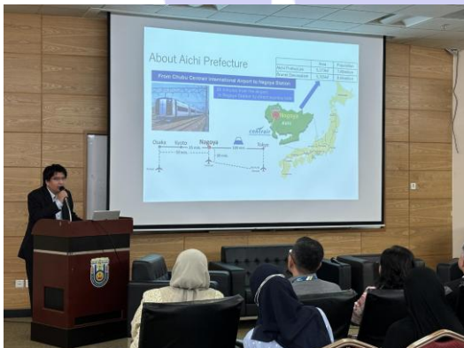
職員による発表の様子

発表の後、休憩を挟んで約30分のパネルディスカッションが行われました。会場からは、「日本人の一般的な英語能力について」「日本での携帯電話契約事情」「日本国内を旅行する際のアドバイス」といった日本に関する幅広い質問が寄せられました。当事務所職員も各々工夫を凝らして回答し、双方にとって実りある時間となりました。